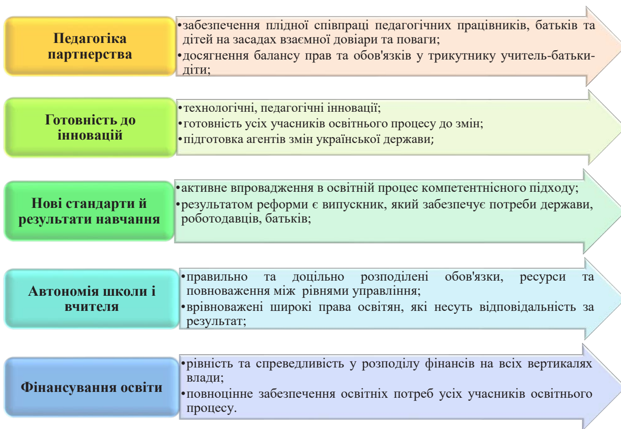
Рис. 1. Концептуальні зміни НУШ

ють повноцінне розкриття термінологічного апарату дослідження. Методами наукової розвідки є аналіз, синтез, порівняння, узагальнення, систематизація теоретичного матеріалу і передового практичного педагогічного досвіду, опитування усіх учасників освітнього процесу та спостереження за діями здобувачів освіти відповідно до основних положень інституційного аудиту, самоаналіз Харківської гімназії № 12 Харківської міської ради Харківської області.